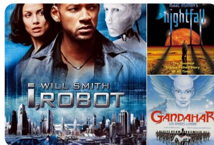
ASIMOV EN EL CINE

sobre ellos y fijó sus conocidas “tres leyes sobre robótica”. Yo, Robot es la novela más conocida de esa colección. Este y otros relatos famosos como El hombre bicentenario fueron llevados al cine con gran éxito. Muchos han sido los intentos desde hace unos cuantos años de realizar una serie de televisión sobre La fundación . Finalmente es Apple TV + la que ha puesto en marcha la adaptación de la obra y ya ha anunciado recientemente algunos miembros del reparto: Lee Pace y Jared Harris participarían en la ficción dando vida al